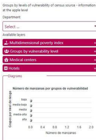
Groups by vulnerability levels